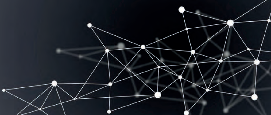
Tableau d'organisation du M2